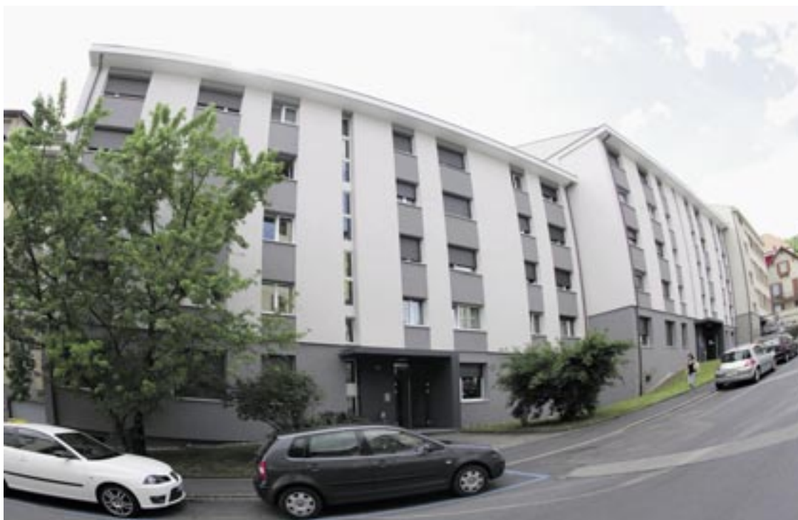
La consommation d'énergie des bâtiments de la rue de Gibraltar 7 à 9 a considérablement diminué.

La quantité d'énergie nécessaire pour leur chauffage a diminué de presque la moitié pour atteindre une valeur de 48 kilowattheures nécessaire pour chauffer chaque année, chaque mètre carré. Ainsi l'objectif annoncé (50 kWh/m 2 /an) est dépassé. Dans ces bâtiments qui couvrent 3'530 m 2 , l'économie réalisée grâce aux interventions représente l'équivalent de quasiment 37'000 litres de mazout. Ces résultats encourageants ont été obtenus en mettant en place sur le plancher des combles une isolation de 14 cm d'épaisseur, en posant sur les façades une isolation périphérique de 17 cm et en remplaçant toutes les fenêtres avec du