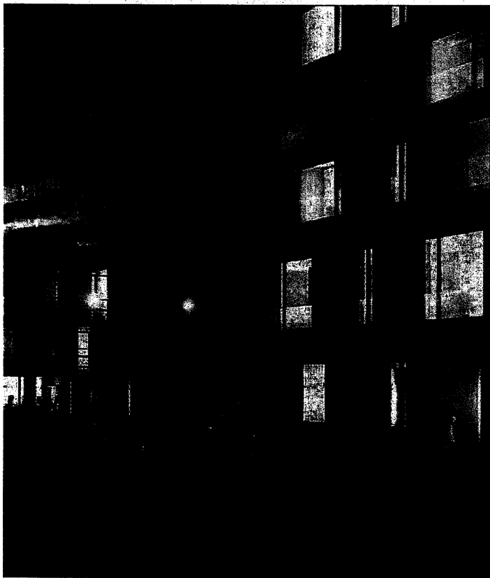
te) rénové et le centre du village en sera métamorphosé. (01)

lessiner son centre pour un investissement de plus t toutefois trouver ce projet un peu trop luxueux.