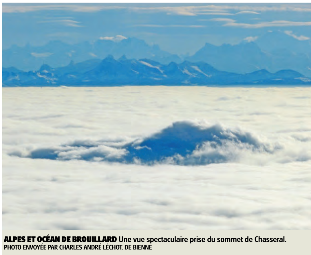
ALPES ET OcéAN DE BROUILLARD Une vue spectaculaire prise du sommet de Chasseral.

S'il faut trouver des locaux dans les années à venir, l'Université de Neuchâtel, partenaire toute proche, aura certainement des locaux adaptés qui se prêteront à l'agrandissement du campus de Microcity.